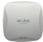
これがアクセスポイントです。