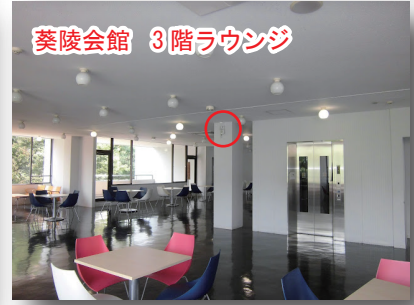
▲ 無線LANアクセスポイントの例

■: [無線LAN] または [情報コンセント] が利用可能。 ■: 利用できません。