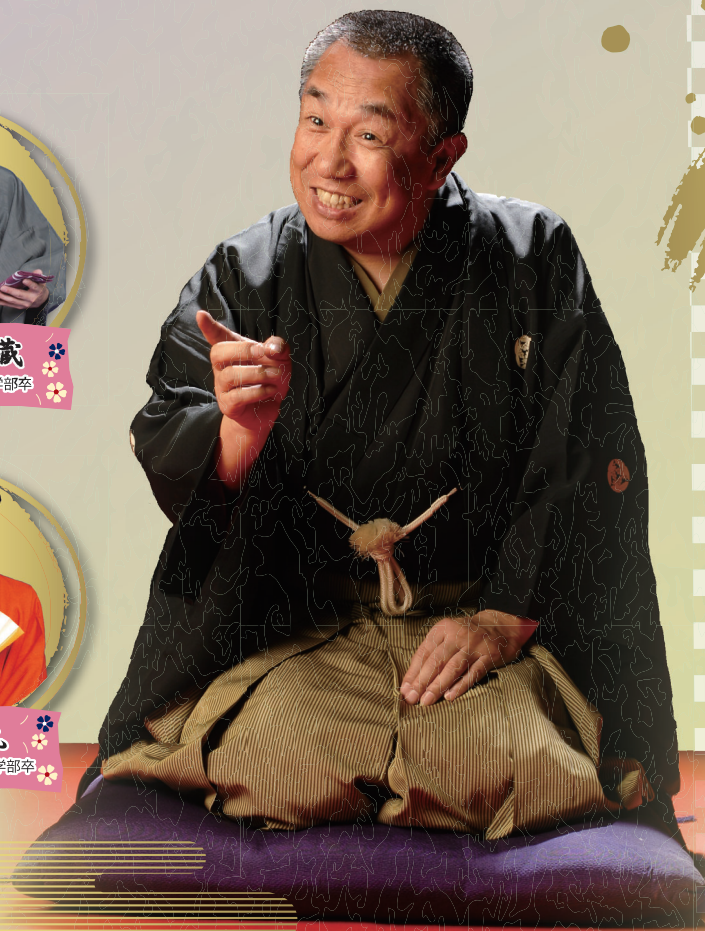
昭和55年 本学経営学部卒