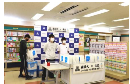
(フードバンク事業の様子)

また上記期間中に、東京経済大学教職員の有志団体「女子学生支援プロジェクト」は、生活に困窮する女子学生を対象に生理用品を配付。コロナ禍の「生理の貧困」により支援を必要とする女子学生がいるのではないかと、2021年6月に女性教職員の有志でプロジェクトを立上げ学内に呼びかけを行い、専任教職員だけでなく、理事や非専任の教職員、派遣スタッフ、教職員のご家族、近隣の方からのカンパによって実施に至りました。生理用品を受け取った女子学生は「コロナ禍での1人暮らしで、アルバイトを思うようにできず大変困っている。毎月の出費になるため今回の生理用品の配付はととてもありがたい」と話してくれました。今後、第2回目の配付を予定しています。