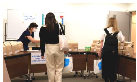
(「女子学生支援プロジェクトの様子」)