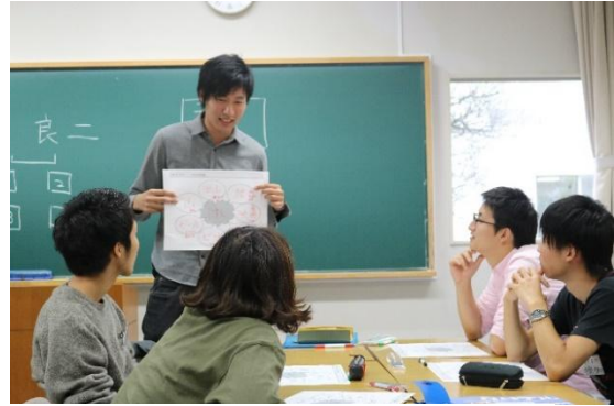
キャリアデザインプログラムでは、就業力を自ら育成する基礎を身につけるための教育を行います。

『キャリアデザインプログラム』では、専門の入門科目を学ぶことを通じて、自らの関心が高い分野を発見し、2年次からの学部を選ぶことができます。以降は、各学部のカリキュラムに沿って履修していくため、十分な専門教育を受けることが可能です。また卒業時には、2年次以降に所属した学部の学士号を取得します。