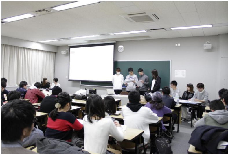
経済学部の報告会風景

「格差問題、地域再生」をテーマとして報告を行ったゼミは、イノベーターとクリエイターの共通性について発表し、大手企業の創業者や著名なプロデューサーの考え方、経営戦略を例に挙げ、「イノベーションにおいて重要なのは独自の着眼点や既存技術の組み合わせ、そしてプロモーション、共創性である」と結論付けました。