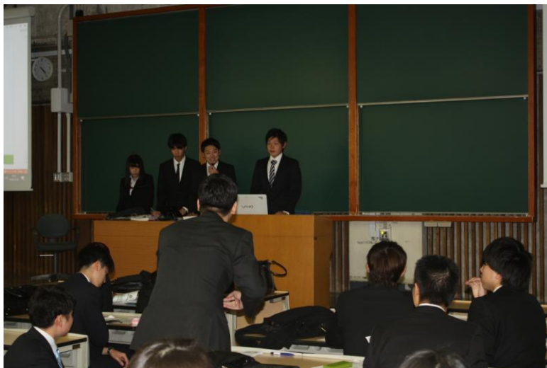
経営学部の報告会風景

情報管理論を研究するゼミはソーシャルゲームについての研究結果を報告し、依存性の高さやユーザー間のトラブルを課題として挙げ、これらを解決するための機関設立を提案しました。