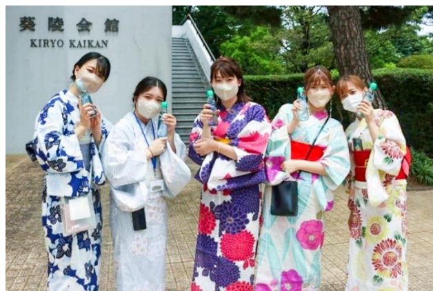
浴衣姿で暑気払いを楽しむ学生

学生からは「打ち水体験は初めて」という声も聞かれ、用意した約200本のラムネが売り切れになるなど大盛況。浴衣を着て参加した女子学生（現代法学部3