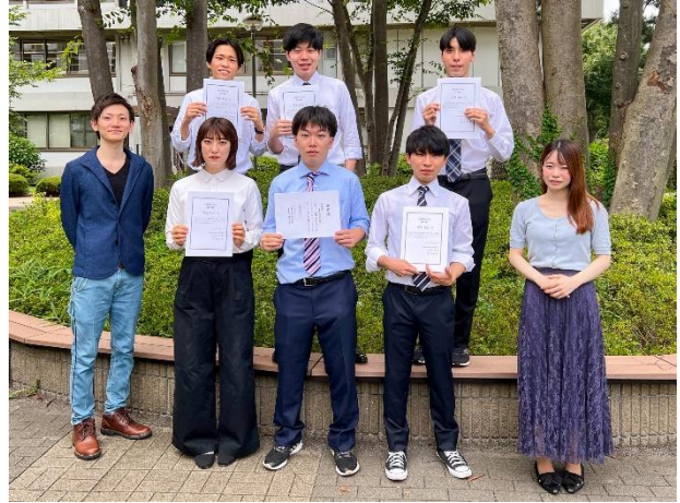
若狭専任講師(写真下段左)とゼミ生

ゼミ長を務めた学生（現代法学部3年）は、敢闘賞受賞について「国際法を学び始めて日が浅く不安だけでしたが、ゼミ生が一丸となって精一杯取り組んだ結果であり、とても嬉しく思います。この経験を今後の人生にも活かしていきたいです」と喜びを語りました。